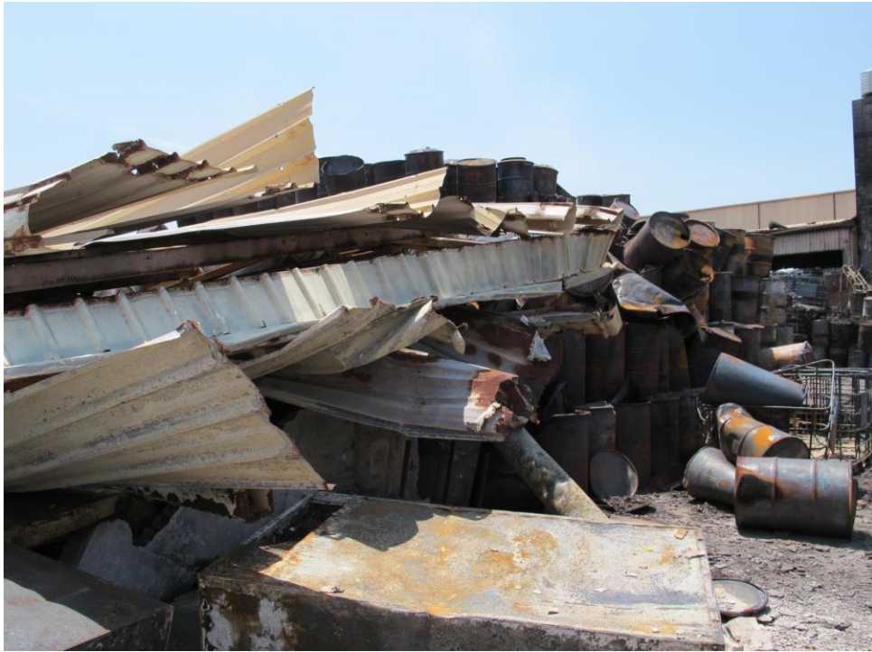
圖 2 廢溶劑桶堆放處