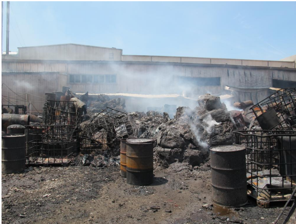
圖 3 起火點