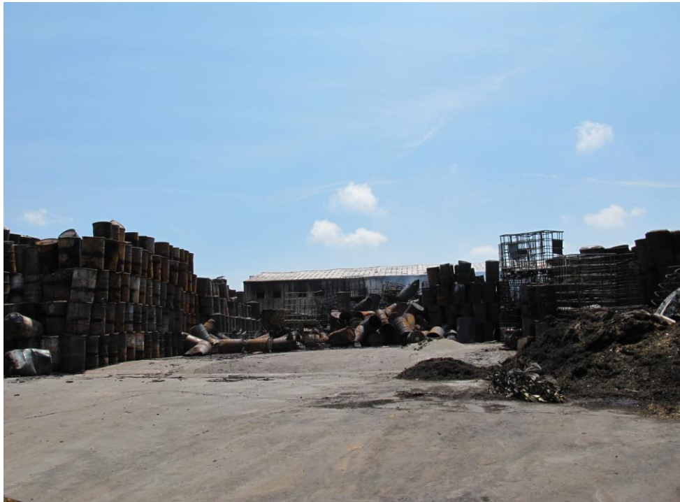
圖 1 現場概況